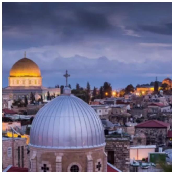
Jérusalem: Ville sainte pour trois religions

D'après Deutéronome 16.1-16 : 1Observe le mois des épis et célèbre la Pâque en l'honneur de l'Eternel, ton Dieu. En effet, c'est au cours de ce mois que l'Eternel, ton Dieu, t'a fait sortir d'Egypte, pendant la nuit. 2Tu feras le sacrifice de la Pâque en prenant dans ton petit et ton gros bétail. 3Pendant la fête, tu ne mangeras pas de pain levé, mais tu mangeras durant sept jours des pains sans levain car c'est avec précipitation que tu es sorti d'Egypte. Tu feras cela afin que tu te souviennes toute ta vie du jour où tu es sorti d'Egypte. [...] 9Dès que la faucille sera mise dans les blés, tu commenceras à compter sept semaines, 10puis tu célébreras la fête des semaines en l'honneur de l'Eternel, ton Dieu, et tu feras des offrandes volontaires. 11Tu te réjouiras devant l'Eternel, [...] 12Tu te souviendras que tu as été esclave en Egypte et tu respecteras ces prescriptions et les mettras en pratique. 13Tu célébreras la fête des tentes pendant sept jours, [...] 15En effet, l'Eternel, ton Dieu, te bénira dans toutes tes récoltes et dans tout le travail de tes mains, et tu te livreras entièrement à la joie. 16Trois fois par an, tous les hommes parmi vous se présenteront devant l'Eternel, ton Dieu, [...] : à la fête des pains sans levain, à la fête des semaines et à la fête des tentes. On ne paraîtra pas devant l'Eternel les mains vides.